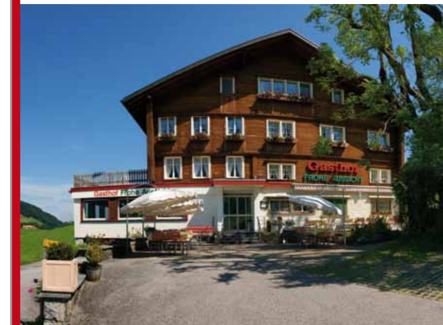
Panorama rund um unser Haus